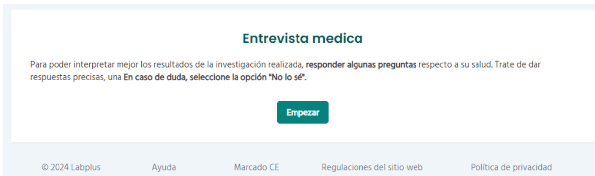
Fig. 2. Página que indica el paso a la fase de encuesta

La encuesta / entrevista médica es una etapa en la que te pedimos que respondas preguntas relacionadas con tu estado de salud. El sistema adapta las preguntas a tus resultados de análisis de laboratorio y a las respuestas que proporcionas, lo que acorta la duración de la entrevista. Haz clic en "Comenzar" para empezar a responder preguntas.